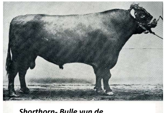
Shorthorn- Bulle vun de „Stiergenossenschaft Warmhörn“. De Mark verlangte düsse „Qualität“.

Noch kann ik dat nich so rech glöven. Wi bleibt dran!