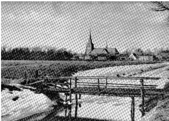
Brüch över dat Sieltog Richtung „Schwarksche Fenn“. (Hüüt geiht dat hier no de School)

annern kunnen meist uk nich över de Groov schmieten. Nummer twee schmeet denn meist bie beide Mannschaften vör de nächste Grov aff.